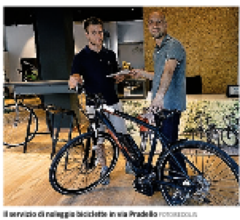
Il servizio di noleggio biciclette in via Pradella

no. Da dove si può proseguire, lungo un percorso pianeggiante, sino all'abitato di Paladina. Il Parco dei Colli di Bergamo si estende per circa 4.700 ettari e comprende una vasta superficie che interessa i comuni di Almè, Bergamo, Momo, Paladina, Ponterosso, Ronza, Soriano, Torre Boldone, Valbrona e Villa di Almè. Chi vuole affittare una bicicletta, oltre al noleggio di via Pradella, può rivolgersi all'associazione Podolepis - Città di destinazione 42, in piazza Mancini, per noleggiare city bike, bici da trekking, bici da cross country (da venerdì, 7-12.30 e sabato, 9-12.30) e all'Ecobike, in piazza Mancini vicino alla stazione della città, dove vengono