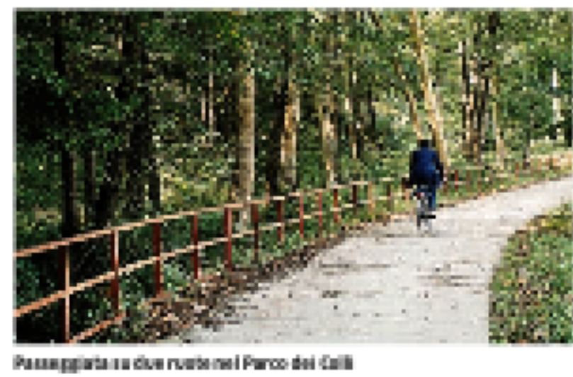
Passeggiata su due ruote nel Parco dei Colli

intera 25 euro. Tra scoperte panoramiche, giardini, ville, orti e antichi monumenti, i percorsi sui Colli sono numerosi. Bastano generalmente un'ora e una cascina che segnala il risarcimento per scoprire città e dintorni in versione ecologica. Tre itinerari presentati dagli uffici del turismo di Palazzo Principe. Il primo porta a Bergamo Alta, con tappe consigliate all'Orto botanico, alla pila, al Castello di San Vigilio, oppure di ritorno alla scalata e di ritorno in Città bassa. Torso Itinerario, quello della Green