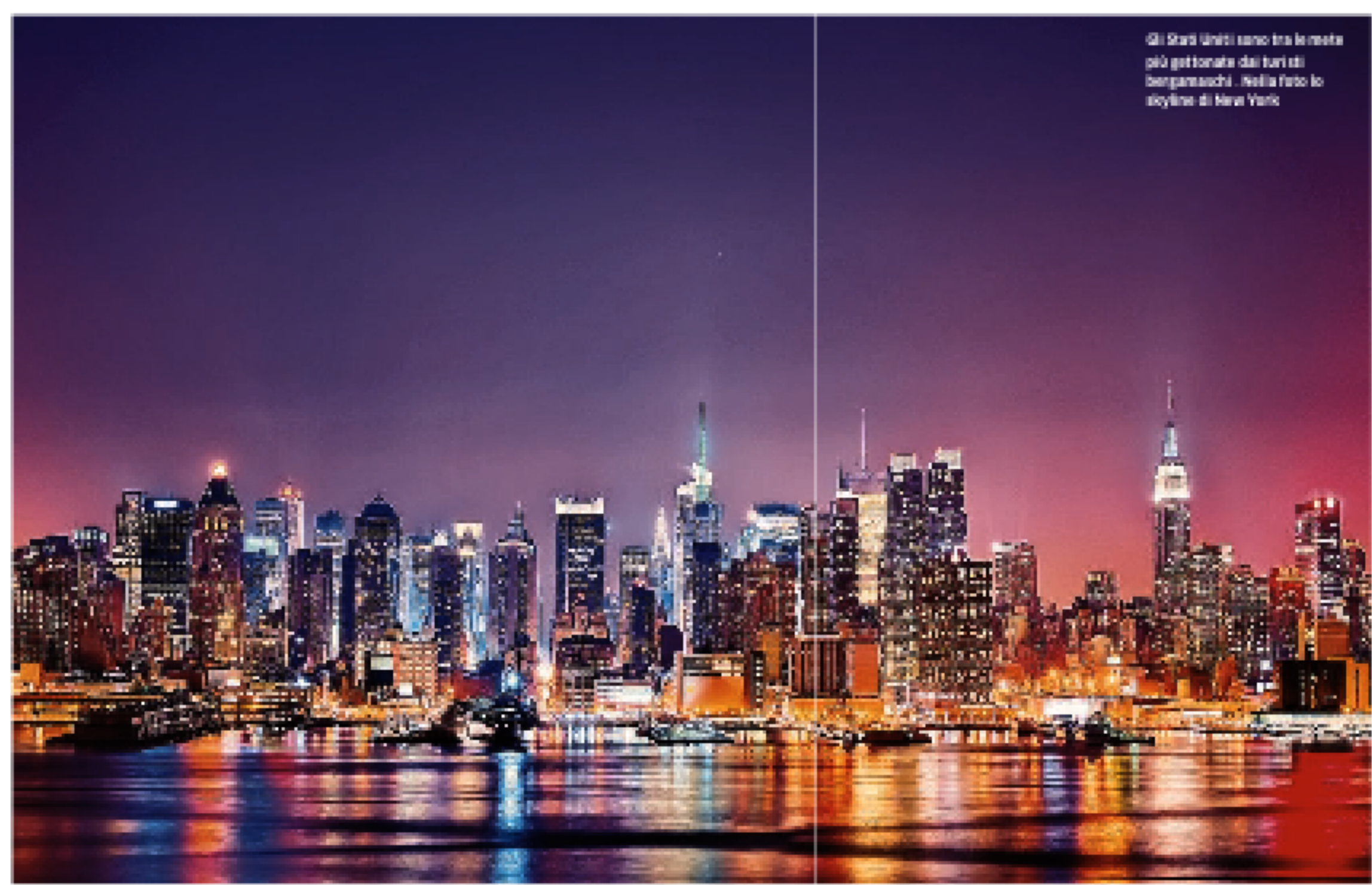
Gli Stati Uniti sono tra le mete più gettonate dai turisti bergamaschi. Nella foto lo skyline di New York

Pellegrini in cammino Tanto anche il turismo religioso, che in Italia è in crescita da un decennio. «I viaggi di fede non soffrono la crisi, i pellegrini che raggiungono la Terra Santa, Roma e Santiago di Compostela sono sempre numerosi». Anche per questo, oltre che per la sua vocazione, Ovet sta allargando il ventaglio delle offerte. Il turismo religioso riguarda tutte le confessioni e prende anche mete culturali. Di qui la scelta di ampliare le destinazioni andando oltre le mete europee ed extraeuropee. Turchia, Grecia, Egitto, India, Sri Lanka e il Messico restano tra le destinazioni più gettonate per la loro ricchezza di beni culturali e religiosi. «Mete alternative del turismo cultural-religioso sono