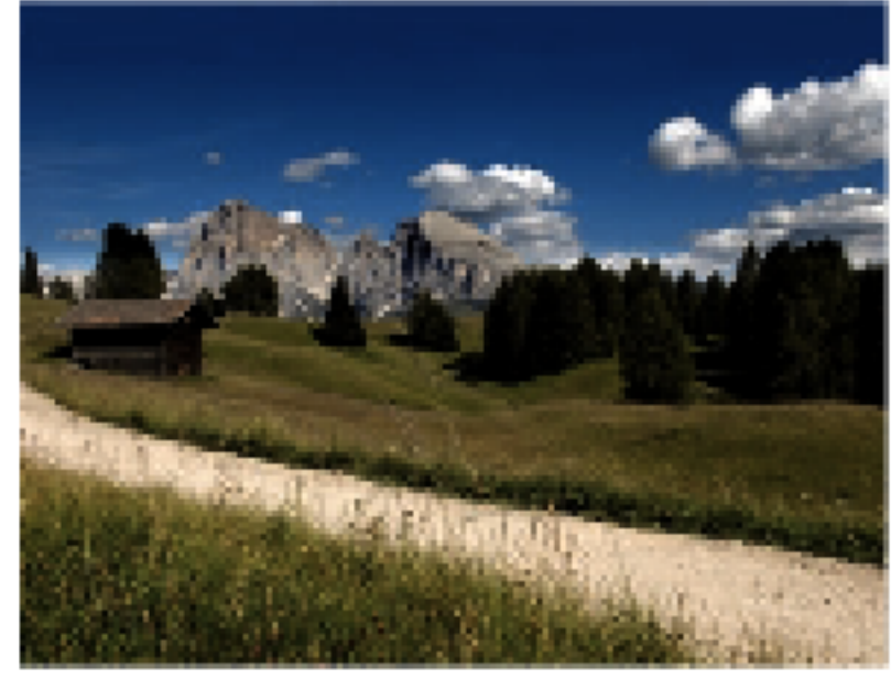
Relax e passeggiate nel verde per chi sceglie le vacanze in montagna

Un albergo nel verde, nato per accogliere famiglie e giovani e recentemente ristrutturato in stile moderno, che nel passato degli anni ha visto crescere la clientela, tanto italiana quanto tedesca. Venti dipendenti, 48 stanze, una piscina coperta e un idromassaggio, l'hotel accoglie ospiti tutto l'anno, ma l'estate è la stagione regina. Le escursioni nell'Alto Adige, con i treni di calcetto e ping pong, le attività di animazione dog e una serie di iniziative più approntate dagli ospiti dell'albergo. In inverno si va a sciare con l'ovovia, che si raggiunge con il bus navetta che ferma davanti all'albergo, d'estate lo stesso impianto di risalita consente di fare passeggiate in quota.