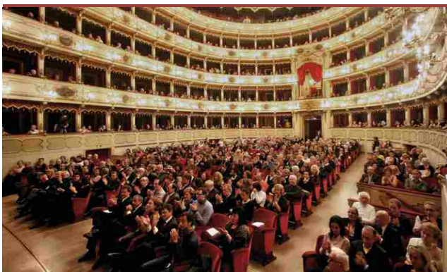
Il teatro Ponchielli

Una speciale isola del gusto è stata dedicata al torrone, il più celebre dei prodotti gastronomici cremonesi, assieme ai dolci elaborati dalla Pasticceria Dossena di Crema: torta spongarda, cannoncini alla crema pasticceria, tartellette ripiene al torroncino e mignon monteverdi.