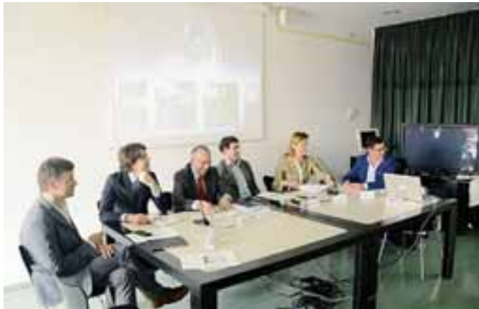
La presentazione di Bergamo Emotion; sopra, passeggiata con le ciaspole

nuove generazioni. I prezzi dei pacchetti variano dai 30 euro a persona per una gita con le ciaspole accompagnati da una guida alpina ai 300 euro per un volo di 60 minuti dall'aeroclub Valbrembo su Bergamo e i Colli, passando sopra il Brembo e l'Ad-da.